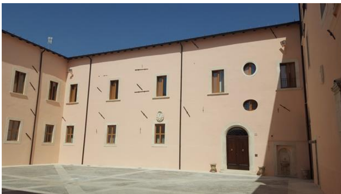
Campo gara - Palazzo Vescovile